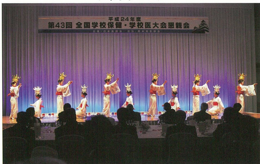
山鹿灯籠踊り（山鹿灯籠踊り保存会）