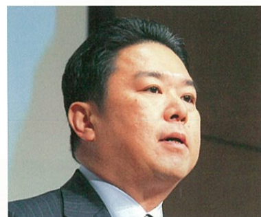
祝辞／熊本市長 幸山 政史 様 代読／熊本市副市長 寺崎 秀俊 様