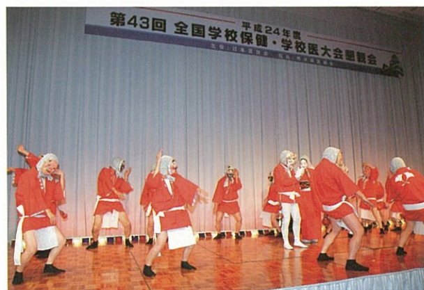
ひよっこ踊り（肥後ひよっこ笑福会）