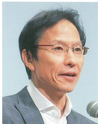
講師／東京大学大学院教授 姜 尚中 先生