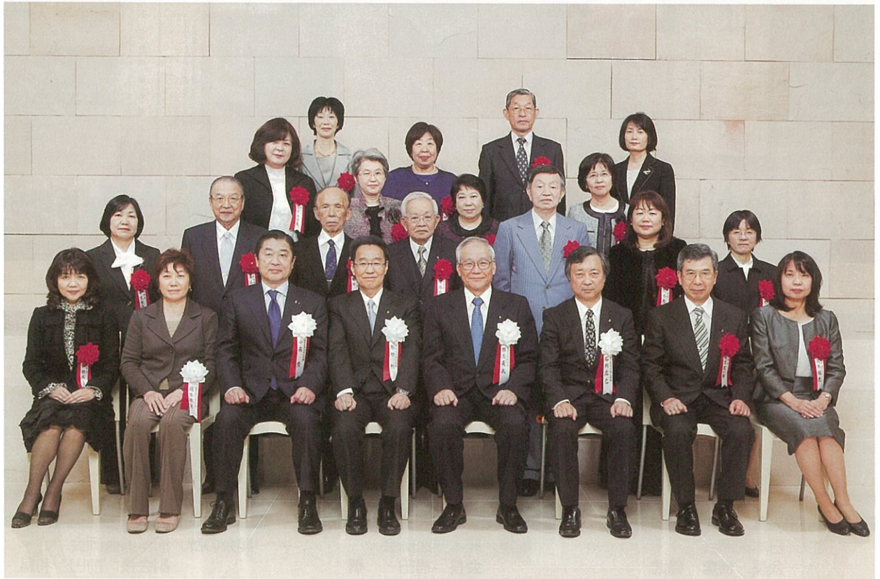
日本医師会長表彰 受賞者記念撮影