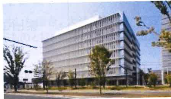
国の現地対策本部 (熊本地方合同庁舎B棟)