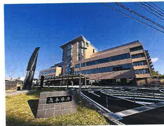
熊本県災害対策本部 (防災センター)