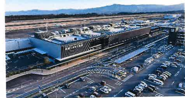
支援物資受入れ拠点 (阿蘇くまもと空港)