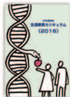
生涯教育カリキュラム(2016)