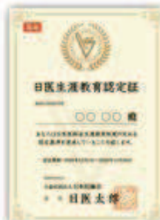
日医生涯教育認定証