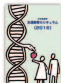
生涯教育カリキュラム(2016)